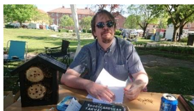
Vinnaren på bi-ordstävlingen.

Vi hade även en tipsrunda om naturfrågor och en ordtävling där man skulle komma på flest ord som börjar på "bi". Vinnarna vann biholk. Alla aktiviteter var mycket uppskattade av besökarna.